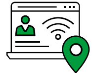
Safety io Grid services